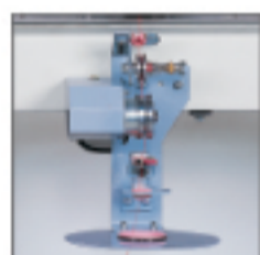
可設定漸減式 電磁張力 Electro-magnetic tension