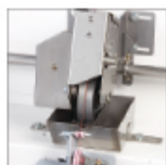
可設定目跟隨 線速之上油裝置 Lick-roller lube system