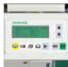
多功能微電腦 控制面板 Control panel